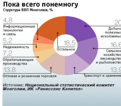
Рисунок 2 – Структура ВВП Монголии в 2011 г. 1